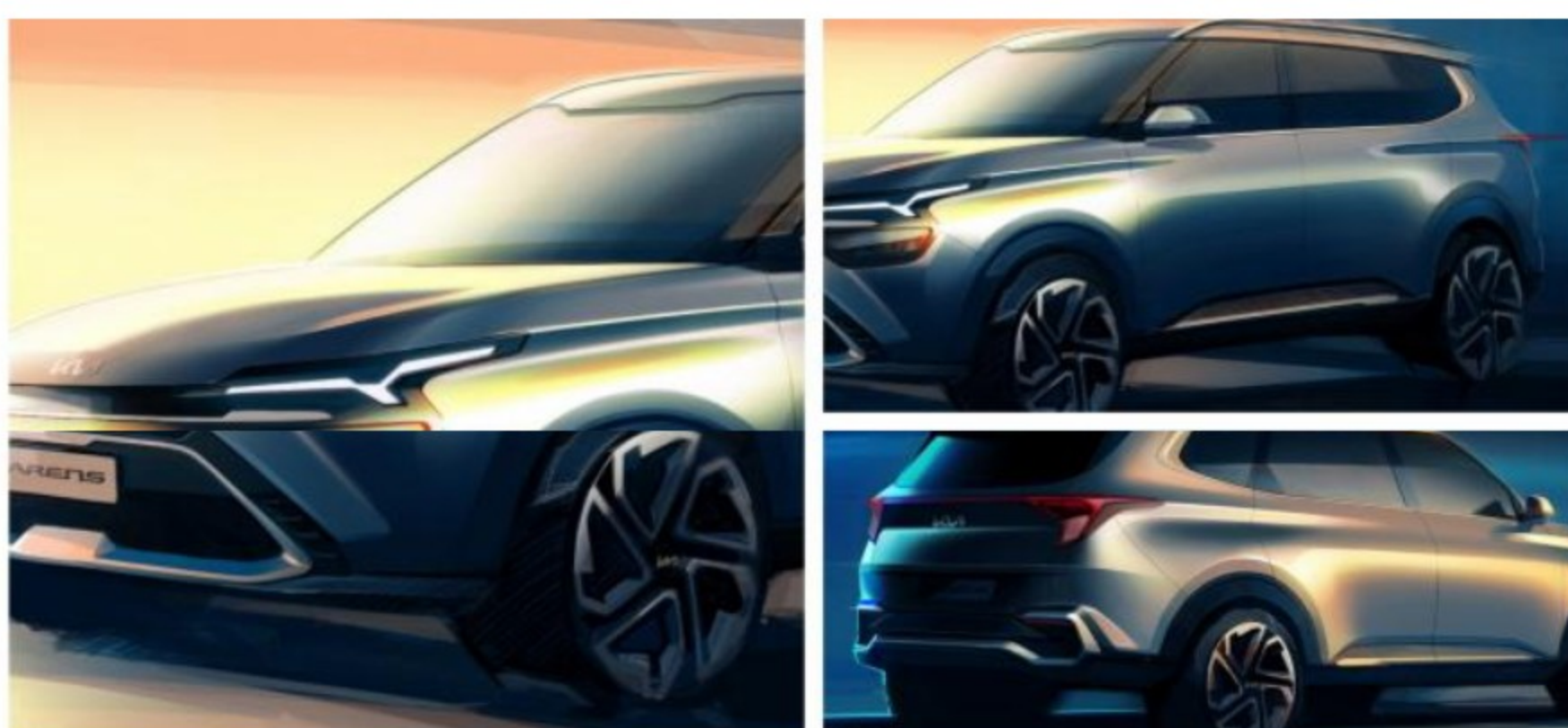
Kia Carens 2022, bocetos oficiales

GIOVANNI AVENDAÑO 11:29 A. M. 07 DE DICIEMBRE DEL 2021