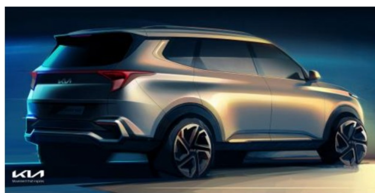
KIA CARENS 2022, BOCETOS OFICIALES

En este último elemento se distinguen las luces de conducción diurna , ubicadas por encima de los faros principales, que se parecen unas gaviotas en vuelo y que van en combinación con un marco de aluminio para la entrada de aire inferior. El mismo toque simula atrás un falso protector inferior.