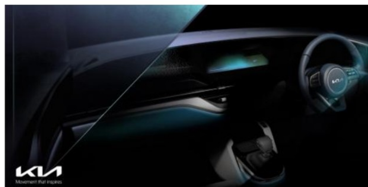
KIA CARENS 2022, BOCETOS OFICIALES

Lo que también se sabe es que la nueva Kia Carens se centrará en el espacio y la practicidad y vendrá con siete asientos , de allí que se vea con una distancia entre ejes tan grande, y será quizá los únicos rasgos que le quedan de cuando era una van, pues ni siquiera se ve que sus puertas vayan a ser corredizas.