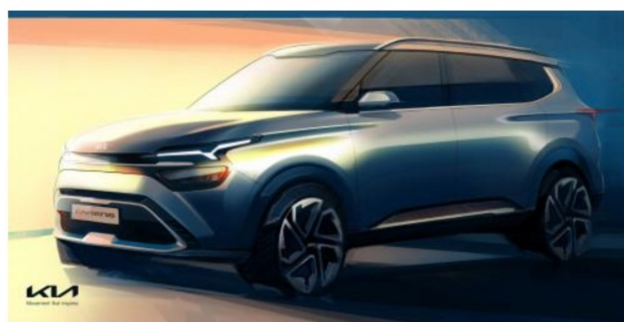
KIA CARENS 2022, BOCETOS OFICIALES

Entonces, para la cuarta generación de la Kia Carens se le instaló un formato de SUV compacta que ya nada tiene que ver con la carrocería monovolumen del modelo precedente que estuvo vigente desde 2012.